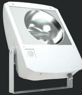
LEADER UM 400