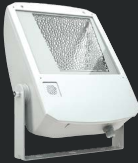
LEADER UM 250H