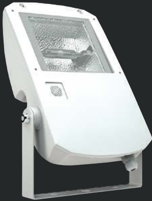
LEADER UM 250S