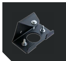
Кронштейн для крепления HB на трос, профиль, трубу. Код заказа - 2311000220.