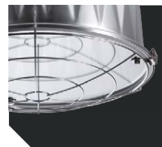
Светильники могут комплектоваться защитной решеткой. Код заказа – 2311000120.