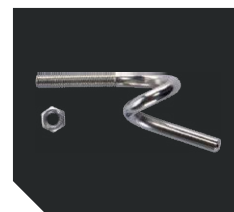
Комплект крепления на трос HB с витым крюком. Код заказа - 2311000150