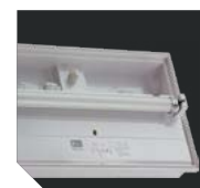
Линейная светодиодная лампа (цоколь G5)