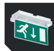
ST 27. Двухсторонний рассеиватель ANTARES