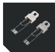
ST 21. Крепежные элементы