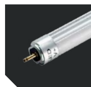
Радиатор светодиодной лампы

Рассеиватель светильника изготовлен из поликарбоната. Пиктограммы для светильника комплектуются отдельно (стр. 398-407). Дистанция распознавания 25 м. Лампа входит в комплект поставки. Пиктограммы для двухстороннего рассеивателя комплектуются с ST 27 (стр. 396). Дистанция распознавания 25 м.