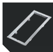
ST 26, белая. Декоративная рамка

Рассеиватель светильника изготовлен из поликарбоната. Пиктограммы для светильника комплектуются отдельно (стр. 398-407). Дистанция распознавания 25 м. Лампы входят в комплект поставки. Пиктограммы для двухстороннего рассеивателя комплектуются с ST 27 (стр. 396). Дистанция распознавания 30 м.