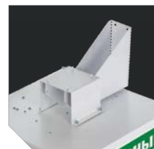
ST-55 – кронштейн для крепления на вертикальную поверхность (код заказа - 2501002910)