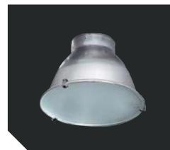
* Защитный алюминиевый отражатель для модификаций с МГЛ