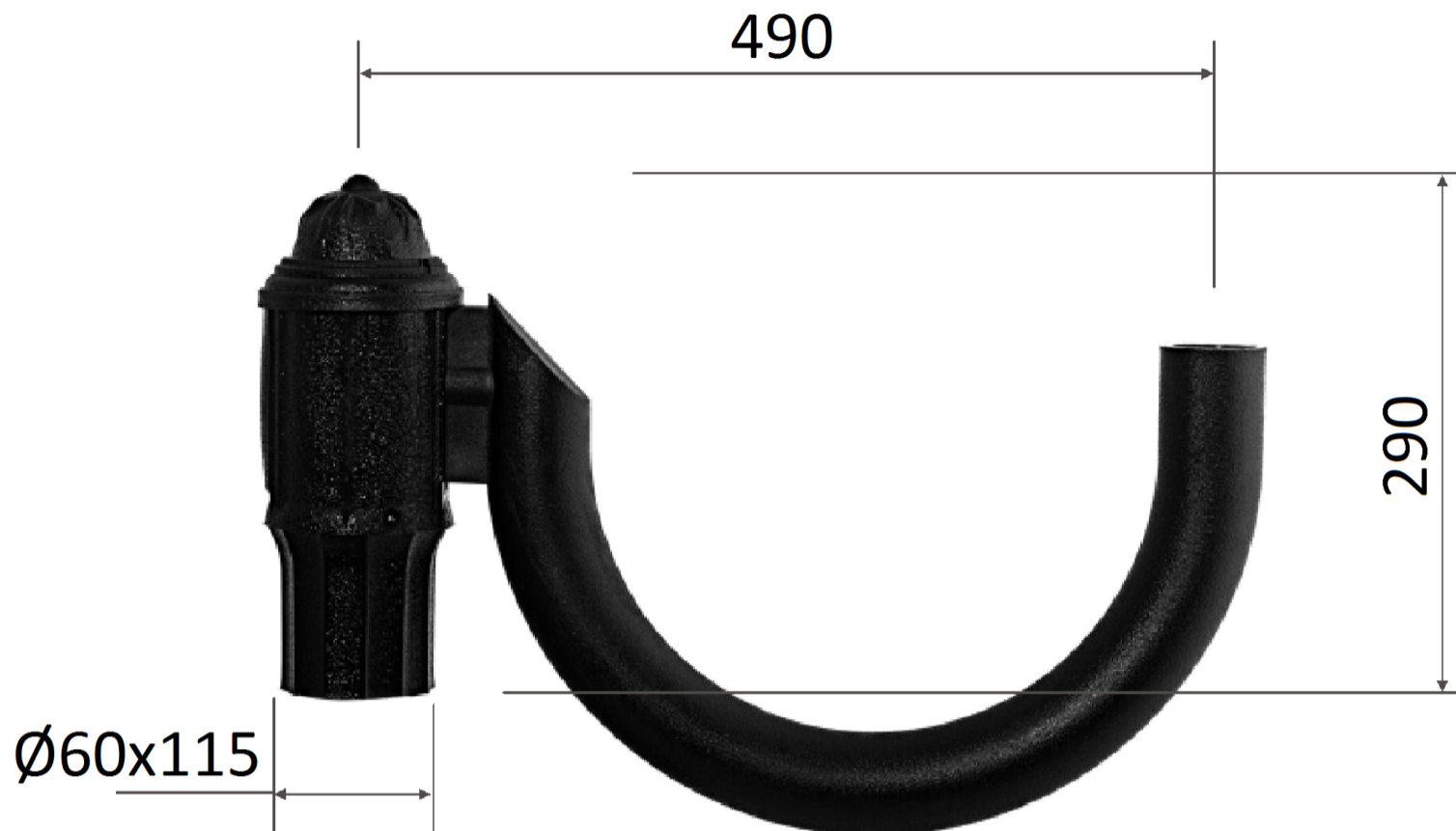
Система консолей Р "1" вверх