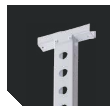
ST 54. Жесткое крепление