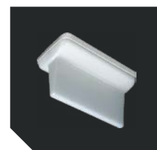
ST 35. Двухсторонний рассеиватель URAN