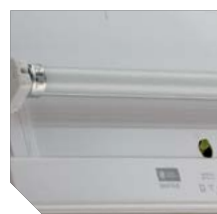
Линейная светодиодная лампа (цоколь G5)

Рассеиватель светильника изготовлен из поликарбоната. Пиктограммы для светильника и двухстороннего рассеивателя ST 35 комплектуются отдельно (стр. 398-407). Дистанция распознавания 25 м. Лампа входит в комплект поставки.