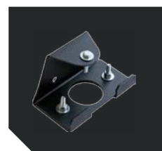
Кронштейн для крепления НВ на трос, профиль, трубу (код заказа - 2311000220)