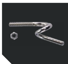
Комплект крепления на трос НВ с витым крюком (код заказа - 2311000150)