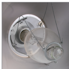
Держатель для ламп ДРИ 700, 1000, 2000 Вт