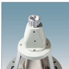
Крепление на трубу G3/4-B.

Безопасность. Защитное закаленное стекло. Специальные держатели для ламп.