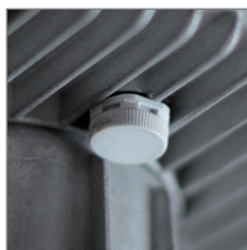
Клапан выравнивания давления