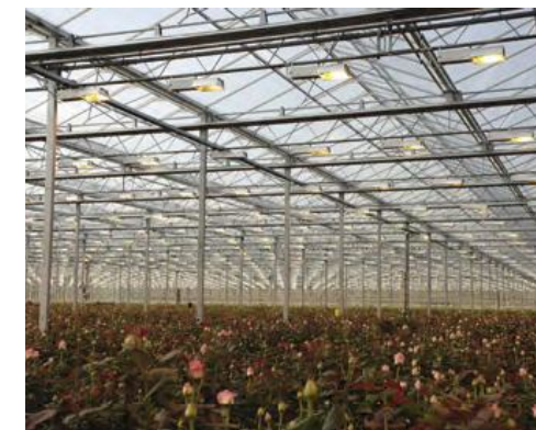
ООО «Мир Цветов», п. Кадошкино (Мордовия)